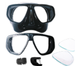
PEÇAS DE REPOSIÇÃO