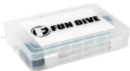
BOX - 17

Instrumento para verificação e ajuste fino da pressão intermediária no regulador 2º estágio.