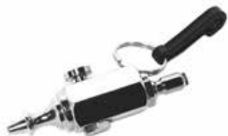
AIR - 01