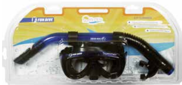
Foto ilustrativa da embalagem do Kit