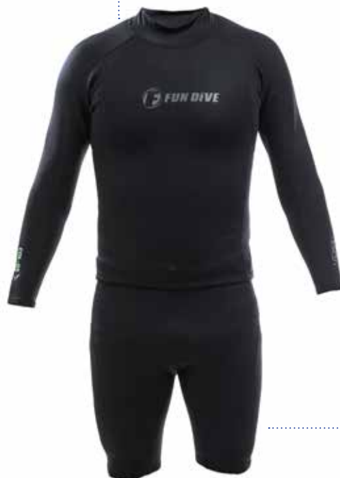
(COL-05-LONGO + SHORT-01)